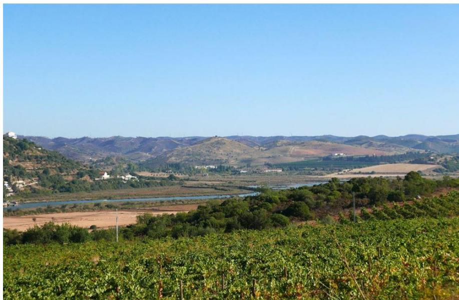
Paysage viticole de l'Algarve

La région viticole de l'Algarve est très certainement beaucoup moins connue que son plus proche voisin au nord, Alentejo. Néanmoins elle aussi mérite qu'on s'arrête sur son passé, son présent et son futur .