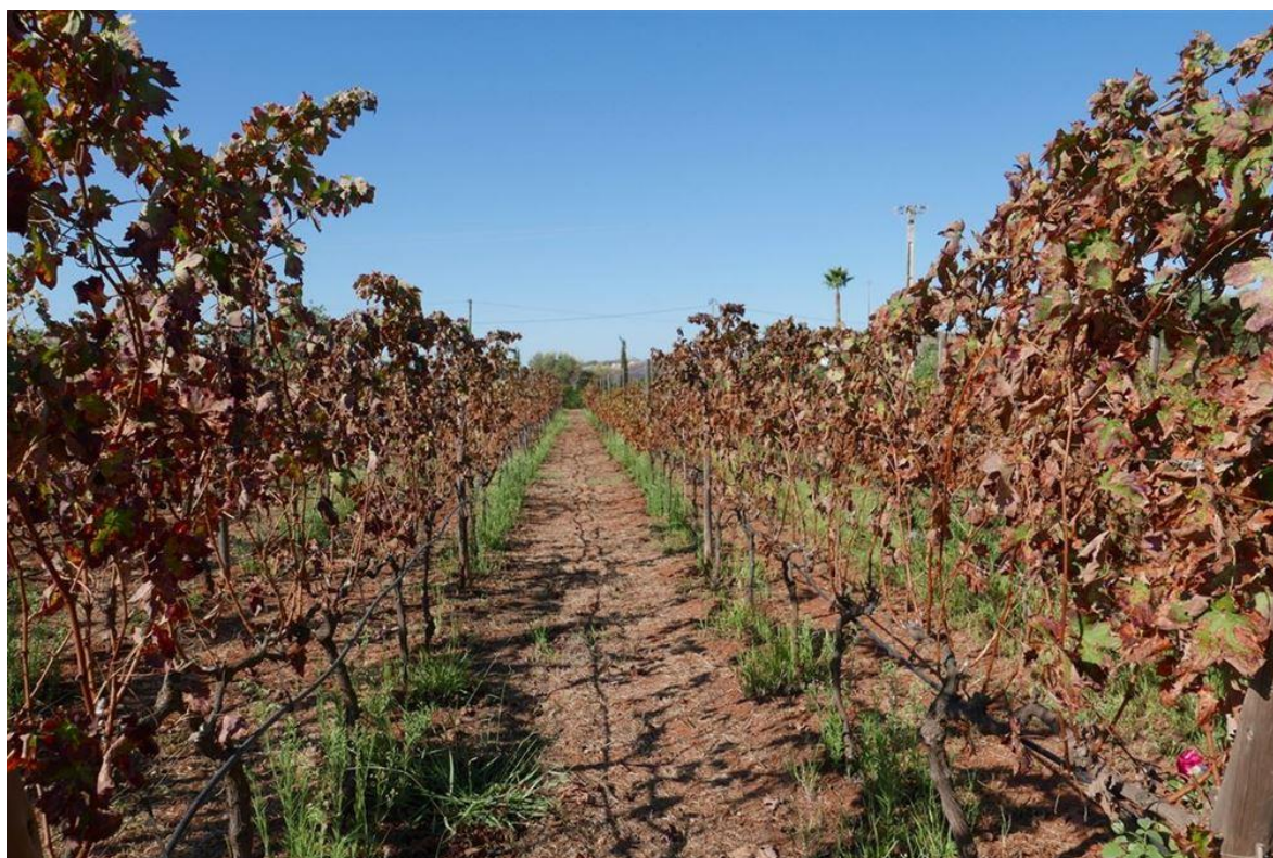
Les sols très variés de L'Algarve, ici c'est des argiles rouges

On se demande même, pourquoi l'Algarve a été si négligée en tant qu'une région productrice de vins pendant tant d'années ?